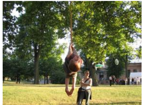
Impressionen von der Langen Nacht der Wissenschaften (links) und EKMAGADI (rechts)