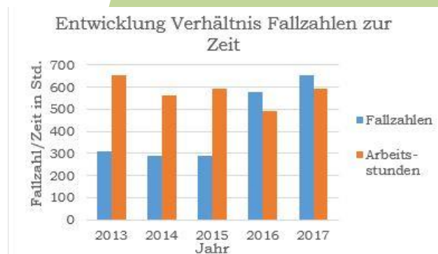
Abbildung 1: Entwicklung Verhältnis Fallzahlen zu Zeit

Dieser Umstand ist nur zum kleinen Teil an der Geschlechterverteilung der Schule (54,5% männlich zu 45,5% weiblich) festzumachen. Wohl eher ist die Ursache dafür sehr viel komplexer und hängt von einer Vielzahl an Faktoren ab. Wenn man sich die Fallzahlen in der Einzelfallhilfe an der GMS „Wilhelm Weitling“ der letzten fünf Jahre anschaut, ist deutlich zu erkennen, dass seit dem Jahr 2016 ein deutlicher Anstieg der Fallzahlen bei annähernd konstantem Zeitaufwand zu verzeichnen ist (vgl. Statistik aus Jahresberichten 2013-2017). Dieser Trend ist in Abbildung 1 zu sehen. Somit ergibt sich aus den