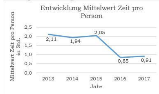
Abbildung 2: Entwicklung Mittelwert Zeit pro Person

steigenden Fallzahlen für die Zeit nach 2016, dass jede Person nur noch halb so viel Zeit bekommt wie in den Jahren zuvor. Dieser Umstand wird in Abbildung 2 verdeutlicht.