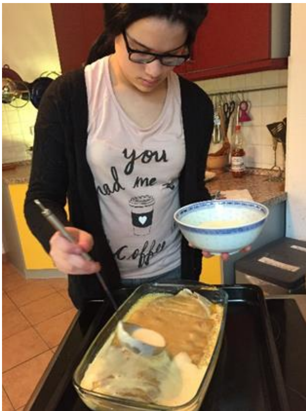
Kochen für die Seele, Lerntypentest, Projektplanung