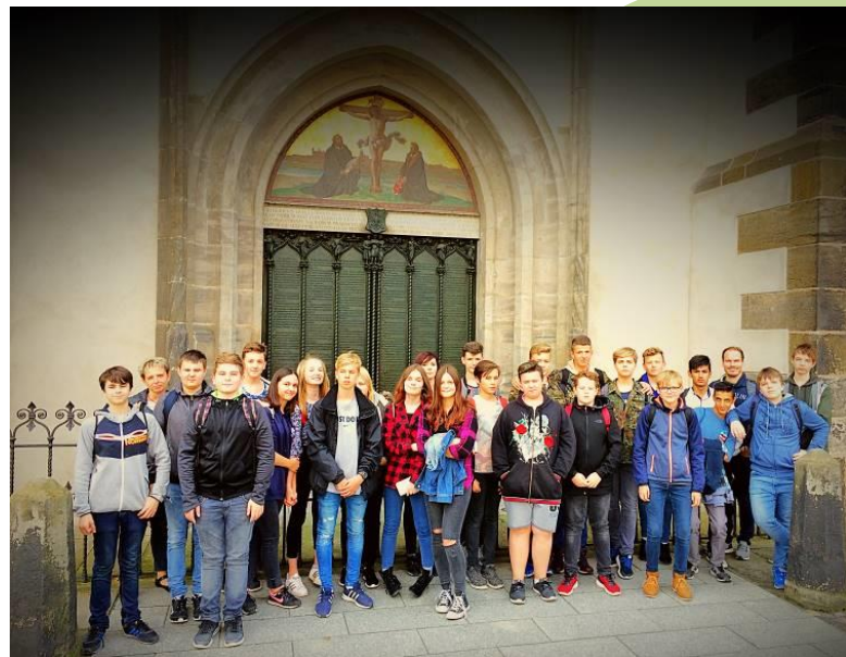
Ausflug nach Wittenberg

Projekttag in Zusammenarbeit mit der Brücke Magdeburg gGmbH, „Schule macht STARK!“