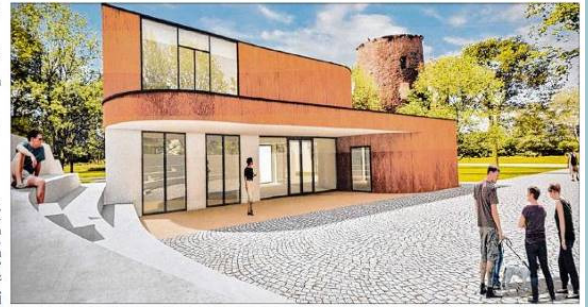
Im Zuge der Sanierung sollen Eingangsbereich und Vorplatz eine Einheit bilden und zum Verweilen einladen.

Nicht nur baulich, sondern auch optisch stehen bei der Sanierung Veränderungen an. Es ist eine Ummantelung mit cortenstahl vorgesehen, der